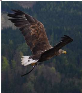
Phoenix 9-11 ans