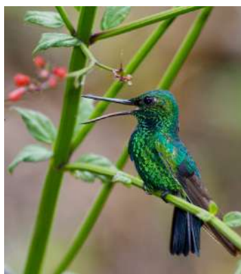
Pinsons 4 ans